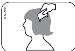
Abb. Durchkämmen des nassen Haares mit Lauskamm: vom Haaransatz bis zu den Haarspitzen